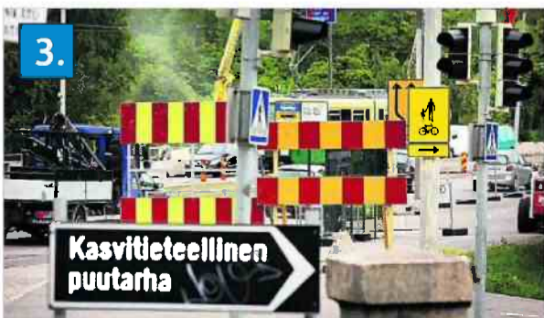
EPÄSELVÄ KIERTOREITTI. Hämeentien sillan peruskorjauksesta johtuvan kiertoreitin kylltettä on vaikea ymmärtää.