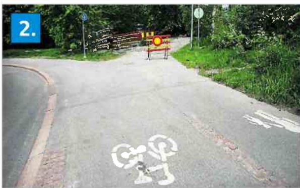
HUONOT OPASTEET. Seurasaaarentieltä lähtevä Mississippinraitti-pyörätie on katkaistu liikenteeltä. Vaihtoehtoinen reitti kulkee ylempänä Pacluksenkadulla, josta uupuvat opasteet.

PIETILÄINEN VASTAA: "Tässä on kyse ilkeästä, sillä Pacluksenkadulla on aivan varmasti ollut opaste. Kyllä siirtely tuntuu olevan jonkinlaista kansallisu- huvia. Emme välttämättä saa tietoa tapahtuneesta ennen kuin joku lähettää asiasta palautetta. Helsingissä on käynnissä 350 aktiivista kaivaustyötä, joiden valvonta on haastavaa."